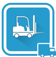
Grands bâtiments de stockage

L'émulseur polyvalent PROFILM AR Hi-Ex est principalement utilisé dans la lutte contre les feux de: