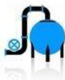
Entrepôts de stockage de produits chimiques